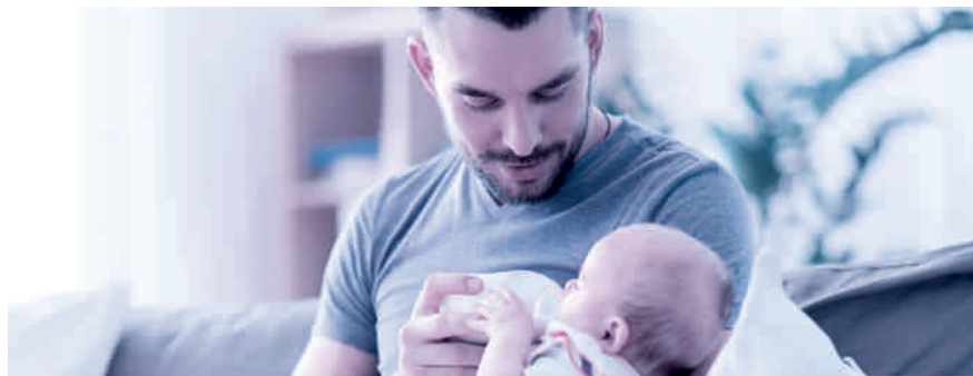
Vaterschaftsurlaub: innert sechs Monaten nach der Geburt zu beziehen.

Das Unternehmen muss dem Vater zehn arbeitsfreie Tage gewähren und hat für diese Zeit Anspruch auf 14 Taggelder. Es ist Sache des Arbeitgebers, bei der Ausgleichskasse – welche auch die EO-Beiträge abrechnet – den Antrag auf die Vaterschaftsentschädigung zu stellen. Der Antrag sollte aber erst gestellt werden, wenn der Arbeitnehmer den ganzen Vaterschaftsurlaub bezogen hat und der Arbeitgeber dies mit dem Antrag bestätigen kann. Die Auszahlung der Vaterschaftsentschädigung erfolgt dann nachgelagert